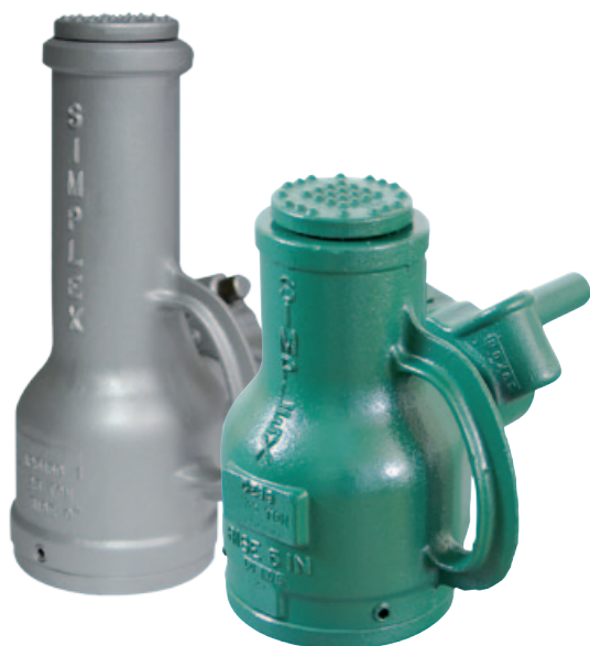
Modelli: JJA2515C & JJ3510D